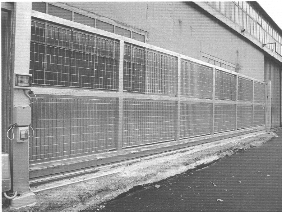
Fotografia del campione.